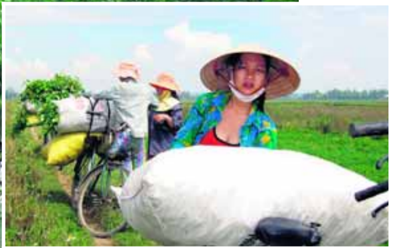
• Het leven is eenvoudig in het Land van de Glimlach; er wordt gevestigd op het land verbouwd voor de eerste levensbehoeften. Boeiend is Vietnam door de directheid en openheid van de bevolking, waar je respect voor krijgt.