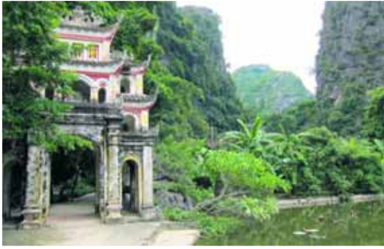
• Van mooie en rustige tempelcomplexen naar de drukte van de steden...