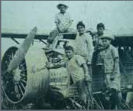
Het gecrashte vliegtuig van Jimmy Angel.