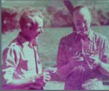
Prins Bernhard kwam graag op bezoek.