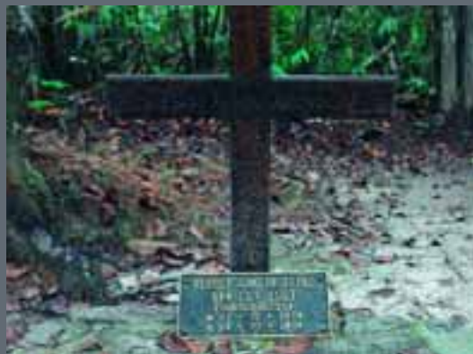
Een eenzaam simpel kruis markeert het graf.