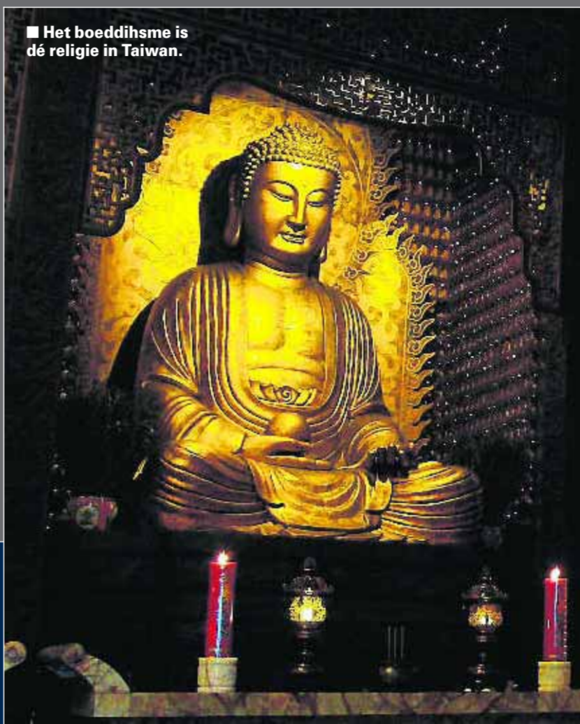
■ Het boeddhisme is dé religie in Taiwan.