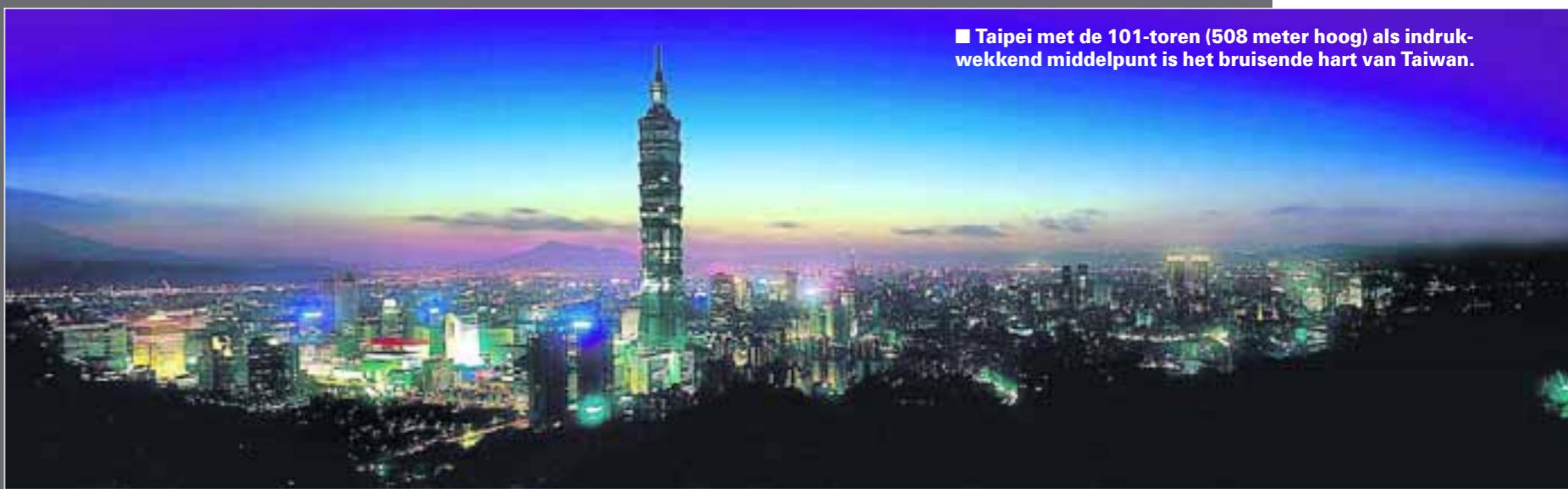
■ Taipei met de 101-toren (508 meter hoog) als indrukwekkend middelpunt is het bruisende hart van Taiwan.