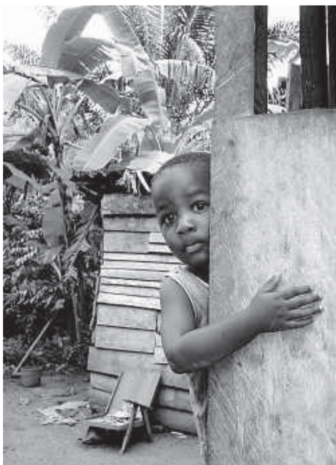
• Achter iedere hoek een kind. De kleine populatie van de twee eilanden is jong. De vraag is welke toekomst ze hebben.