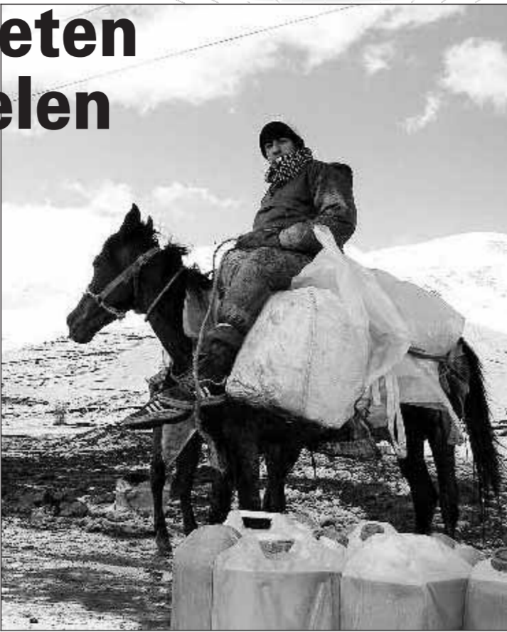
• Een smokkelaar met jerrycans vol benzine.

marga-strijder. Koerdistan: een moeilijk plaatsbaar kind van de rekening in een nog steeds verscheurd land. Vanuit het noorden is het brandstofprobleem niet minder groot sinds Turkije sinds begin van dit jaar geen benzine meer wil leveren. Wegens geringe raffineermogelijkheden exporteerde Irak naar zijn buurland en kreeg benzine terug. Maar met die transactie zou een schuld zijn opgebouwd van 500 miljoen dollar. Naar: „Hoe een van de grootste olieproducerende landen nu met muilezels benzine moet binnen smokkelen. De wereld op z'n kop.”