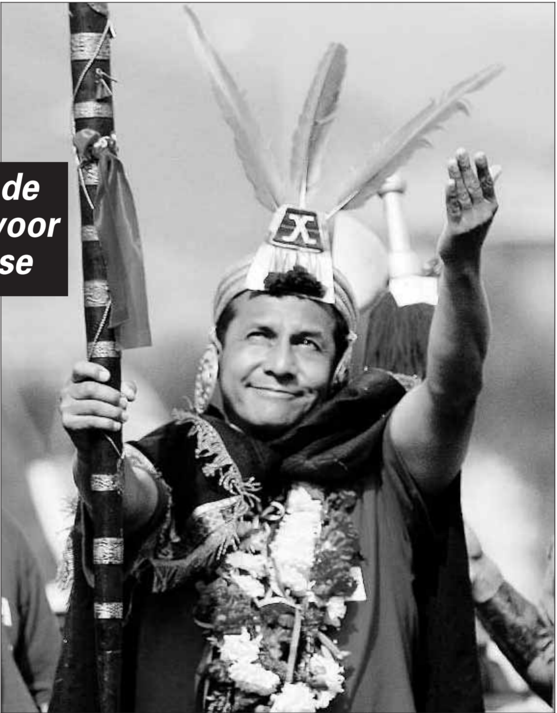
• Presidentskandidaat Humala, gekleed in een traditioneel inca-gewaad, zwaait naar aanhangers in de stad Cuzco. De radicale nationalist staat op winst volgens de peilingen. Humala heeft grote plannen voor Peru, zoals de cocaate uit de taboesteer halen.

Ollanta Humala Tasso doet Peru sidderen van hoop en vrees. De uit het niets gerezen presidentskandidaat voor de verkiezingen morgen is voor de goeddeels indiaanse onderklasse de nieuwe verlosser, want ondanks de vorstelijke economische groei (vijf procent) onder de verguisde president Toledo leeft de helft van de bevolking van hooguit 1,60 euro per dag. De blanke bovenlaag krijgt het echter Spaans benuwd van de nationalistische oorlogsveteraan, die de vrije markt aan banden wil leggen.