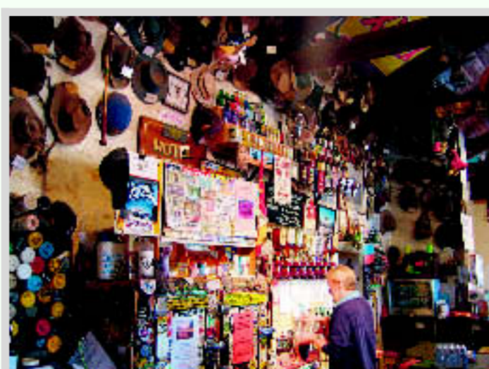
■ William Creek: natuurlijk een pu. Er staan her en der wat huisjes waarin totaal 13 mensen onderdak vinden.