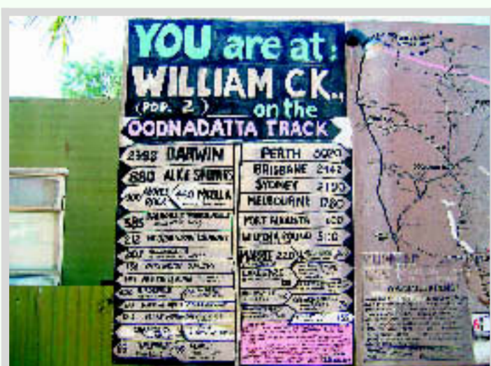
■ 6000 kilometer afleggen in tien dagen....

Betoota piepklein gehucht in 'Down Under'