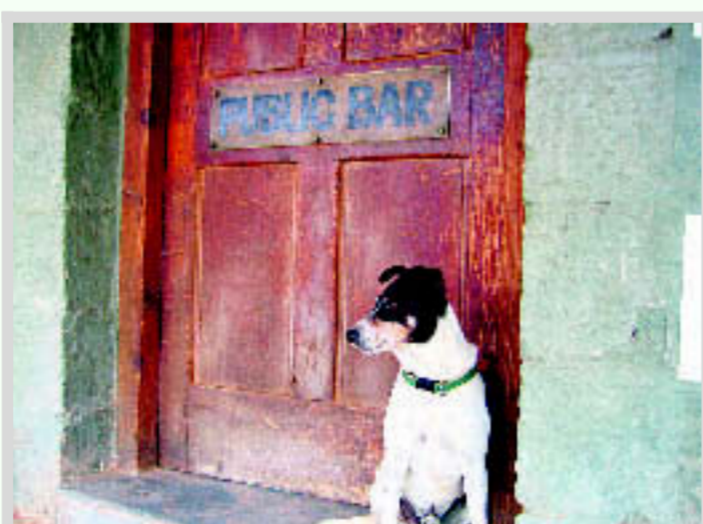
■ Van mooie vrouwen heb je in Betoota geen last...